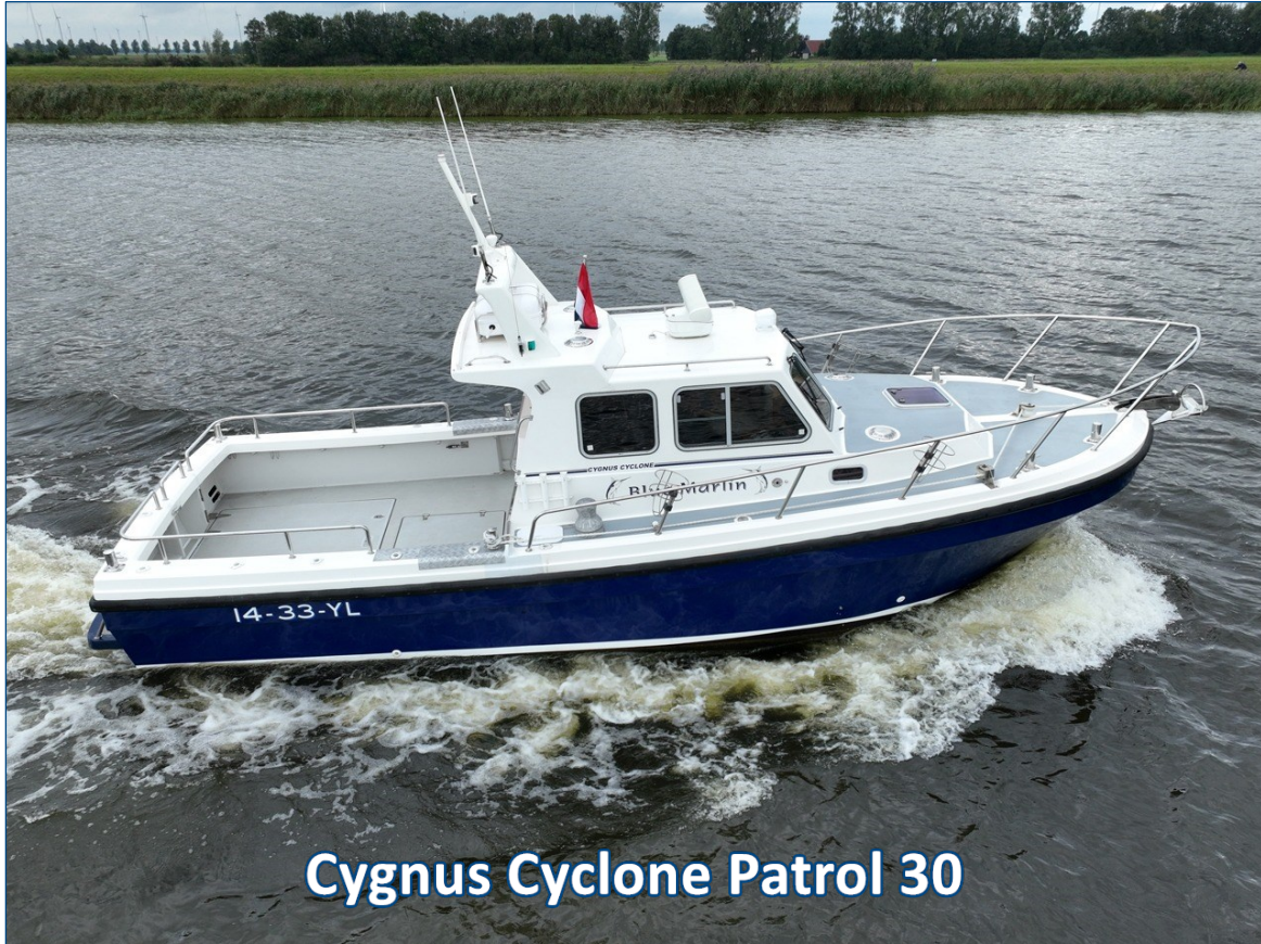
Cygnus Cyclone Patrol 30